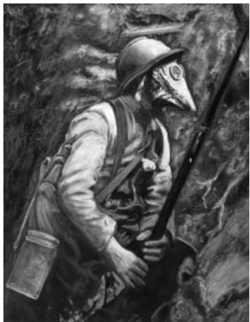
Soldat dans une tranchée se préparant à une attaque au gaz