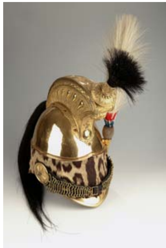
Casque de colonel des dragons, modèle 1845, avec son aigrette Armée du Second Empire Prêt du Musée de la Guerre de 1870 et de l'Annexion, Gravelotte

Sous son règne, la France connaît une croissance économique sans précédent et redevient une grande puissance diplomatique et militaire.