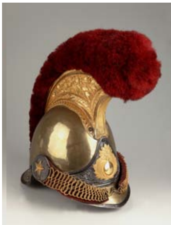
Casque d'officier des carabiniers de la garde Musée de la guerre de 1870 et de l'Annexion, Crédit photo : Mignot