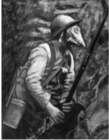
Soldat dans une tranchée se préparant à une attaque au gaz

Un parcours dans le musée autour de plusieurs objets-clés dévoile les points communs et les différences entre les conflits de 1914 et 1870, notamment dans la nature du matériel utilisé. L'espace mémoire indique en quoi la guerre de 1870 annonce celle de 1914