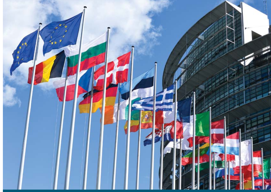
Le parlement de Strasbourg au coeur de la démocratie européenne